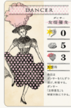
キャストカード 32種 / 各1枚