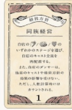
経営方針カード 5種 / 各1枚