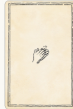
交渉カード 3種 / 各3枚