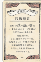
経営方針カード 5種 / 各1枚