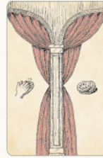
ステージカード 2種 / 各3枚