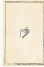
交渉カード 3種 / 各3枚