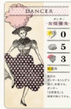
キャストカード 32種 / 各1枚